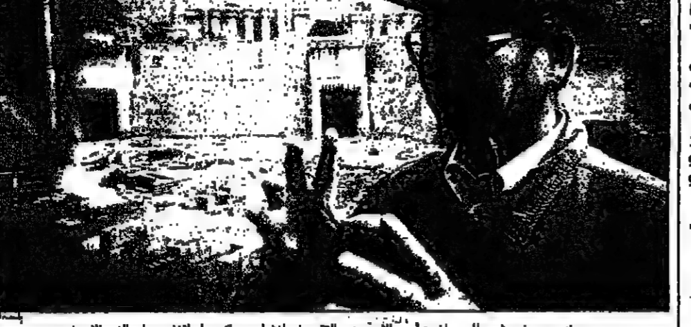
مهندس صيني يشرح للمصنفين امين الاحد عن التقدم في إنشاء سد كاسبار لانهض على النهر الاصفر...